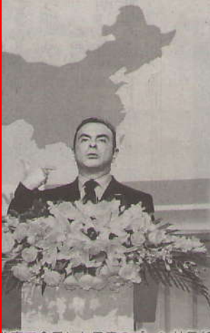
北京で会見した日産のゴーン社長(26日)